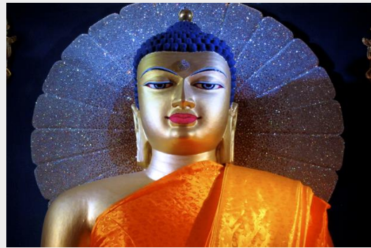
หลวงพ่อบุรพพุทธรูปเมตตา