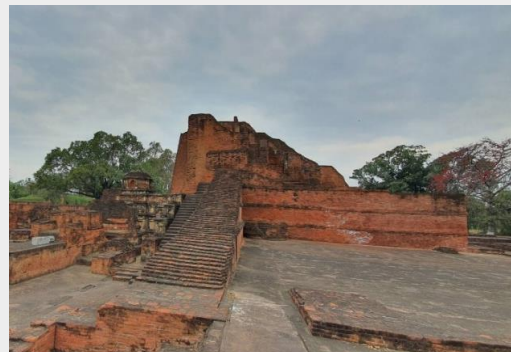
สารินตรสถูป มหาวิทยาลัยนาลันทา