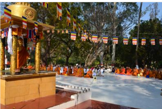
วัดเวฬุวันวิหาร