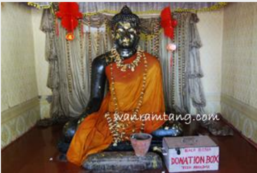
หลวงพ่อดำ เมืองนาลันทา