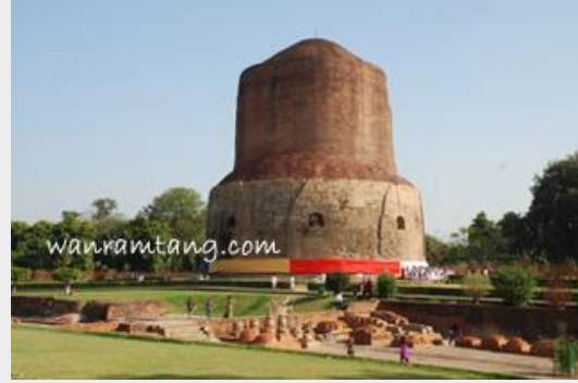
ธัมเมกขสถูป สถานที่แสดงปฐมเทศนา