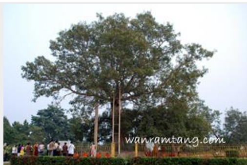
ต้นอานันทโพธิ์ ภายในเขตวันมหาวิหาร