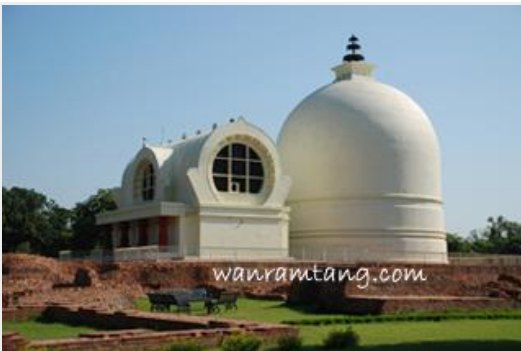
ปรินิพพานสถาน สถานที่เสด็จดับขันธปรินิพพาน