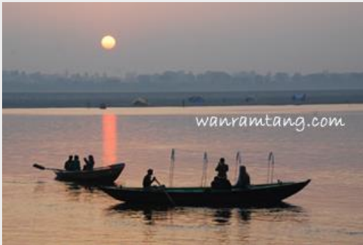
อาทิตย์ขึ้น ณ ฝั่งแม่น้ำคงคา - พาราณสี