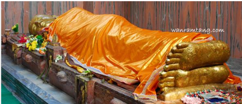
องค์พระพุทธรูปปรินิพพาน