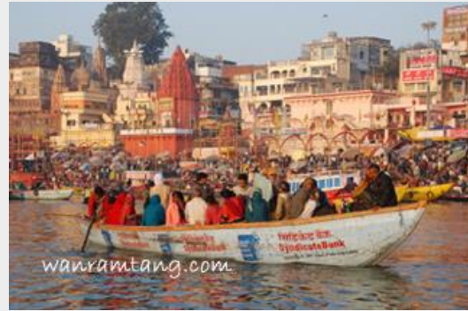
ล่องเรือแม่น้ำคงคา - พาราณสี