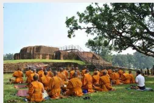
วัดนิโครธาราม

19.00 น. กลับเข้าสู่ที่พัก กินอาหารค่ำ แล้วพักผ่อนตามอัธยาศัย