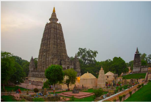
อภิธรรมพุทธสถาน มหาเจดีย์พุทธคยา