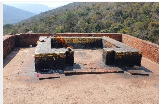
ยอดเขาศิขฌภูฏ มूलคันธภูฏี