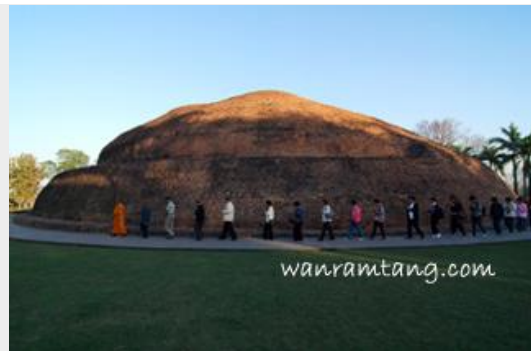
มกุฏพันธเจดีย์ สถูปที่ถวายพระเพลิงพุทธสรีระ

แล้วไปสักการะ มกุฏพันธเจดีย์ ซึ่งอยู่ห่างออกไปประมาณ 1 กิโลเมตร สถูปที่ถวายพระเพลิงพุทธสรีระ หลังวันปรินิพพาน 7 วัน กล่าวคำบูชาสถานที่ถวายพระเพลิง สวดมนต์ ปฏิบัติบูชาตามสมควรแก่เวลา