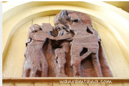
ศิลปะสลักภาพพุทธประวัติปางประสูติ