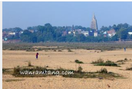
ริมฝั่งน้ำเนรัญชรา ที่เหลือแต่ผืนทราย