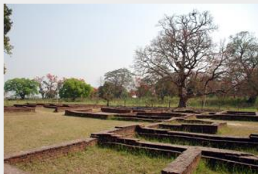
กรุงกบิลพัสดุ์

วัดนิโครธาราม เป็นอารามที่พระเจ้าสุทโธทนะ พร้อมด้วยพระประยูรญาติ แห่งกรุงกบิลพัสดุ์ สร้างขึ้นถวายการต้อนรับ พระสัมมาสัมพุทธเจ้า คราวเสด็จนิวัตพระนคร สร้างขึ้นเพื่อให้พระพุทธเจ้าประทับ พร้อมด้วยพระอรหันต์ 20,000 รูป